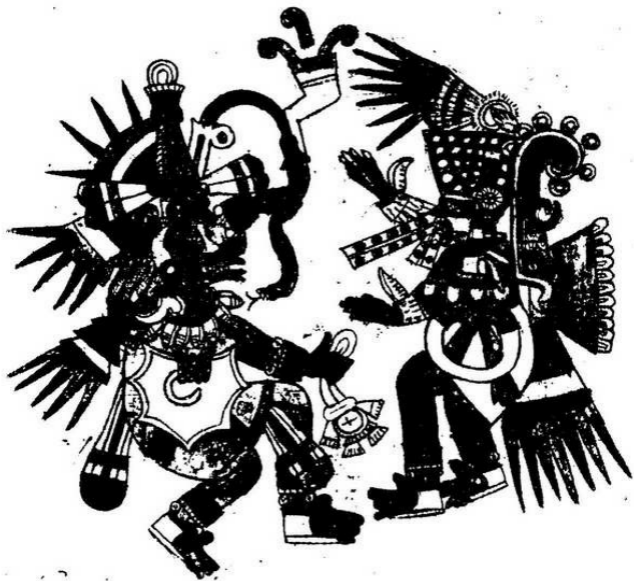
Figura 1. Quetzalcóatl y Tezcatlipoca.

Las leyendas del Méjico precolombino afirman que los mundos de la materia y del espíritu coexisten y que cada uno de ellos posee algo que el otro necesita. En esta pintura del Codex Borbonicus azteca, la tensión dinámica entre