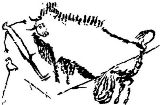
Figura 8. Escena de caza (Lascaux). Escena de caza de una cueva de Lascaux que representa un bisonte destripado y un hombre con rasgos de pájaro y el pene erecto, muy probablemente un chamán en trance. Junto a él se halla un pájaro posado en una rama.

Fuente: Tomado de The Way of the Animal Powers de Joseph Campbell. Reproducido con la autorización de Harper Collins Publishers Inc. Copyright 1989 by Harper and Row.