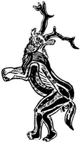
Figura 6. El brujo de Les Trois-Frères. Una figura compuesta por diferentes elementos que combinan diversos símbolos masculinos: los cuernos de un ciervo, los ojos de un búho, el rabo de un caballo salvaje o un lobo, una barba humana y las garras de un león.