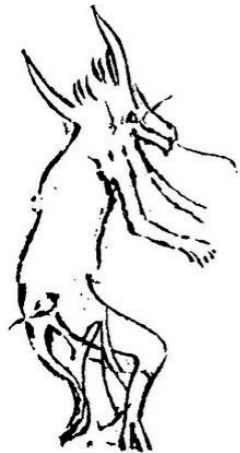
Figura 9. El danzarín. Una figura chamánica en movimiento de la cueva llamada Le Gabillou.